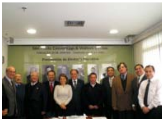
A DIRETORIA DO SPCVB RECEBEU A PRESIDENTE DA EMBRATUR NA SEDE DA FUNDAÇÃO